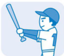
スポーツ、海・山 のレジャー時に