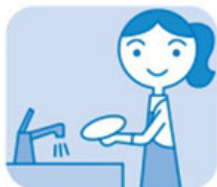
ご家庭での 水仕事に