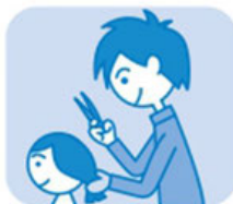
美容院、理髪店 の職場で