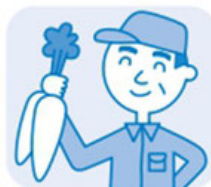
農業・漁業 の職場で