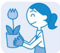
ご家庭での 園芸時に