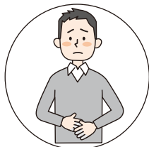
おなかの弱い方の 整腸に