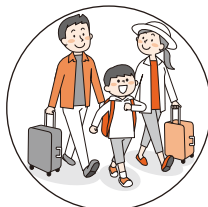
旅行など環境の変化で おなかの調子をくずしたときに