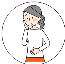
おなかが はったときに