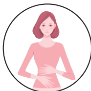
整腸 (便通を整える)