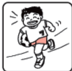
発育期・偏食児に