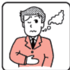
病中病後・胃腸障害に