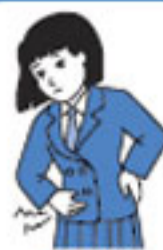
生 理 痛