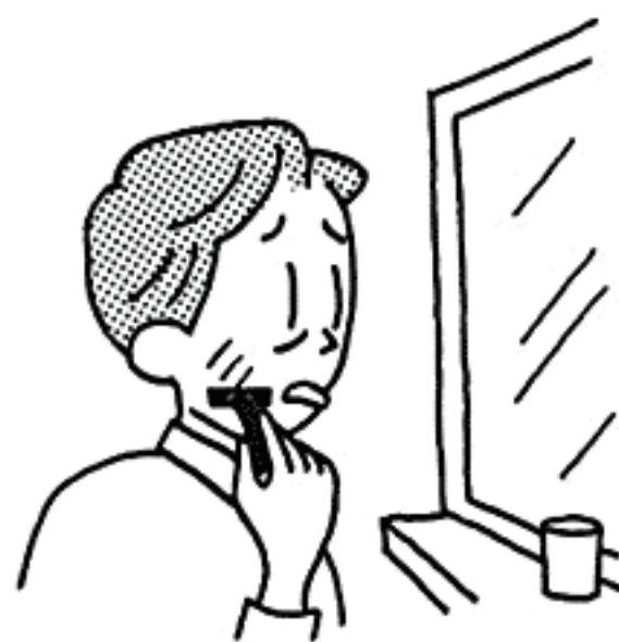
創傷面の殺菌・消毒