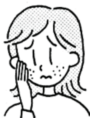
感染皮膚面の消毒