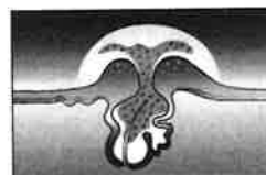
ニキビの頭部を開き 皮脂を吸収