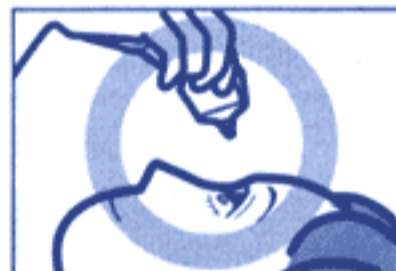
容器の先を下に向けて点眼