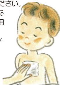
ラブ・オン法の効果