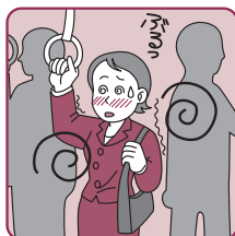
体力が消耗している時に