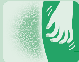
乾皮症で カサカサ の肌