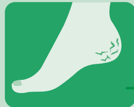
硬くぶ厚くなった カチカチ かかと