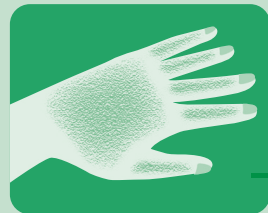
水仕事などで ガサガサ の手指