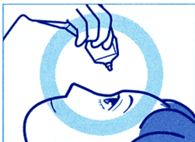
容器の先を下に向けて点眼