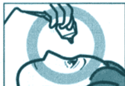
容器の先を下に向けて点眼